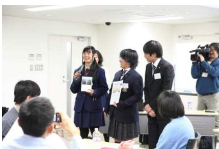
2015年キッズナウのイベント

KIDS NOW JAPAN専務理事、NPOカタリバードパイザー、ラジオパーソナリティーなど幅広く活動。小さな命の意味を考える会代表。スマートサバイバープロジェクト特別講師。元教師。54歳。