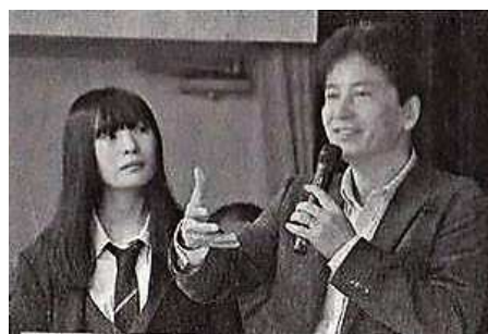
2018年 大阪枚方市にて