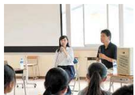
2018年 宮城県内の中学校にて