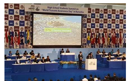
2016年 世界高校生津波サミットin高知